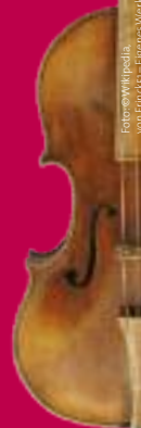
Fotografie: pedas von Franz S. Egner/Werk