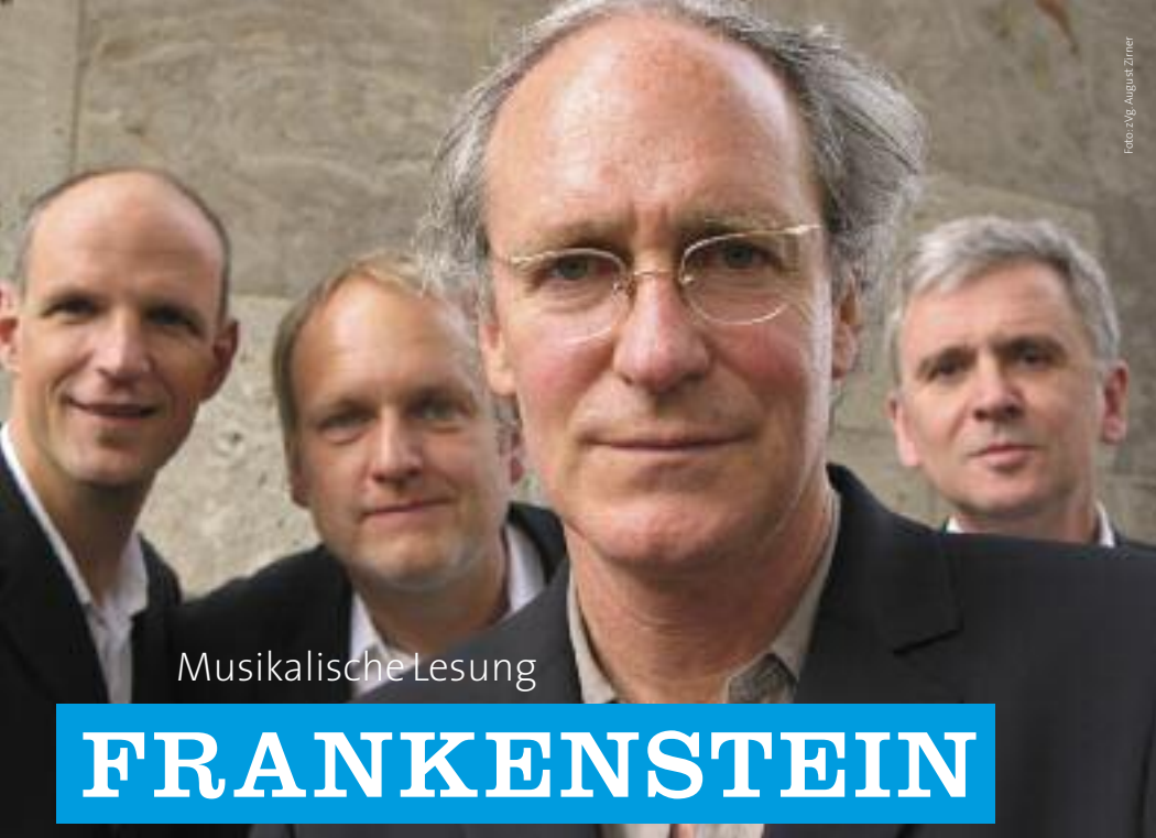
August Zirner